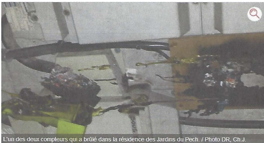
L'un des deux compteurs qui a brûlé dans la résidence des Jardins du Pech.